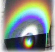
虹のできるしくみは？