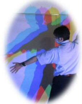
偏光板で作製した ファンタジーアート