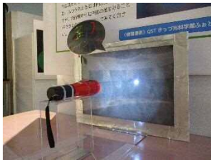
虹が浮かんで見える3Dレインボー

光と色についての特別企画展を開催します。 「光の三原色」「偏光グラフィック」「虹のしくみ」「錯視」など展示や実験、体験などをお して、学びを深めることができます。