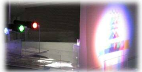
カゲの色が・・・